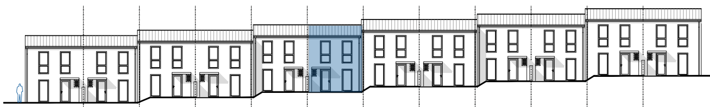
pohled uliční od západu