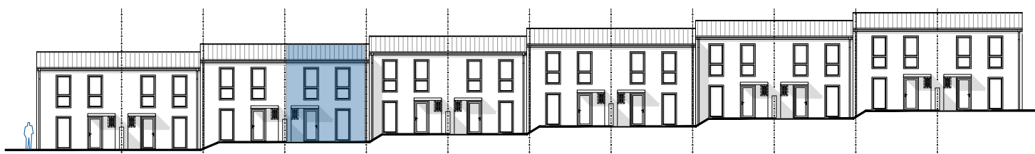
pohled uliční od západu